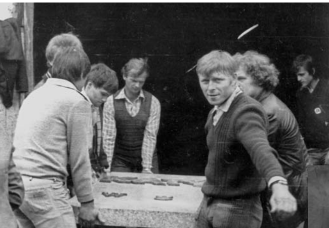
Potajemne wyniesienie pomnika z garażu i wwiezienie śmieciarką na teren Cmentarza Powązkowskiego 31 lipca 1981 r.

W latach osiemdziesiątych z inicjatywy rodzin pomordowanych, duchownych i opozycjonistów na terenie niektórych parafii rzymskokatolickich upamiętniono ofiary zbrodni, wmurowując tablice, tworząc inskrypcje itp. Między innymi w kościele św. Boromeusza na warszawskich Starych Powązkach