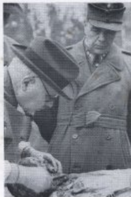
Bild 16 Aufsteigende Gottesdienste bei der Kirche Für die Welt im Jahre 1911