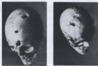
Bild 17. Zwei Fälle von durchlöcherter Schädelkapsel. Einwirkung im Hinterhaupte, nach erfolgter Entfernung des Am- putierten des linken Oberarmes (siehe Bild 16). Links ist die Wunde, rechts ist die Schädelkapsel.