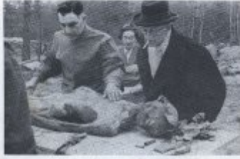
Kit 18. Ausgewählte Gegenstände bei der Charité- für den Winterkrieg mit Frau Harter/Gast