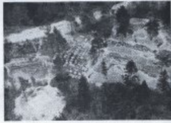
Bild 1. Landschaft im Klamath- und Deschutes-Gebirge, im südöstlichen Enden des Cascade-Kette in Oregon.