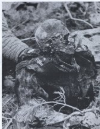
Бил 27. Да габриеловиот интервенционист Експерт Јанес да дава да Тейлс септици. Моно да Тейлс да имунизација.