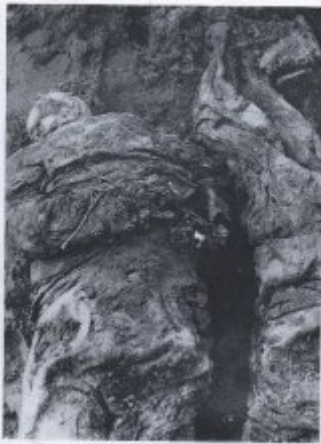
Bild 18: Die auf dem Boden getrockneten Leinwand... (Caption text is partially obscured and difficult to read)