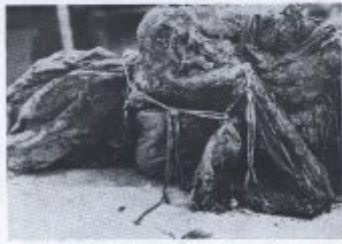
Bild 17: Aufgeblähte Leinwand, die durch die Hitze... (Caption text is partially obscured and difficult to read)