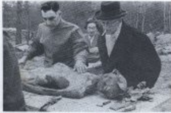
Kit 15. Ausländische Christenmission bei der Christen- heit. (Bilder von Prof. H. H. H. H.)