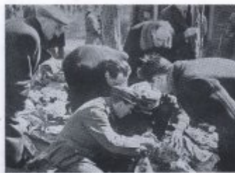
Bild 23. Eine Gruppe von Bauern in der Nähe von Trier, die ihre Arbeit im Feld machen.