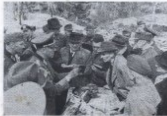
Bild 15 Die weltliche Christenheit bei der Gottesdienst Kurz vor dem weltlichen Jahre Gottesdienst