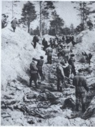
Bild 2. Die Kammstein