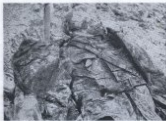
Бил 20. Индустрискиот цент Експерт Јанес да дава да Тейлс септици. Моно да Тейлс да имунизација.