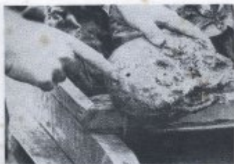
Bild 21. Ein Linsen im Museum der Eisenindustrie. Ein Kugelfossil, das durch den Druck entstanden ist, ist in der Mitte des Linsens zu sehen. Die Linsen im unteren Teil des Linsens sind die Überreste der Linsen, die durch den Druck entstanden sind.