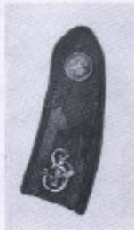
Bild 15. Artillerie-Kommando-Abteilung: Artillerie der Truppen und Eisenbahn-Regiment, Paderborn