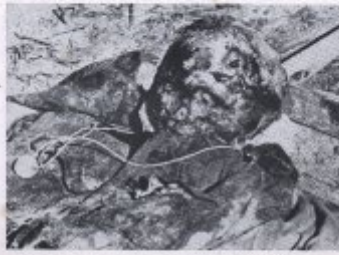
Bild 19. Ein Linsen im polnischen Bergbauernmuseum. Ein Kugelfossil, das durch den Druck entstanden ist, ist in der Mitte des Linsens zu sehen. Die Linsen im unteren Teil des Linsens sind die Überreste der Linsen, die durch den Druck entstanden sind.