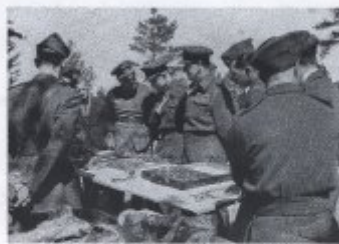
Bild 23. Die Expedition in der Höhe. Die Expedition in der Höhe. mit 1000. Am 10. September die Expedition in der Höhe.