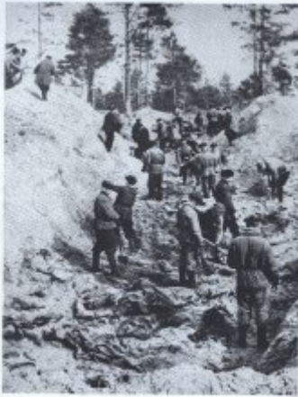
Bild 2. Die Arbeiter