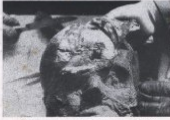
Bild 15. Kugelwunde eines Mannes (Kugelwunde des Schädels) im Hinterhaupte. zu Nr. 1000 des Archivs des Kaiserlichen Instituts für Chirurgie