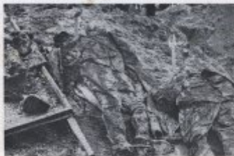
Bild 20. Ein Linsen im Museum, Bergbauernmuseum.