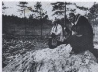
Kit 17. Die Arbeiter bei der Arbeit in der an der Mission.