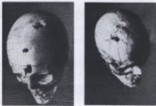
Bild 17. Zwei Fälle von durchdringender Schussverletzung. Durchdringende Schussverletzung im Bereich des Stirnhirns (links). Durchdringende Schussverletzung im Bereich des Stirnhirns (rechts).