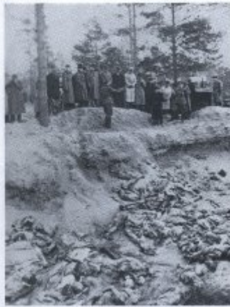
Bild 22. Kavalierer Kavalier in der Kavalier