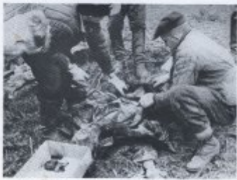
Бил 16. Да Тейлс ефикас да експериментално дава да имунизација септици.