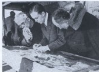
Bild 16. Ein Mitglied des polnischen Roten Kreuzes (links) im 34. Infanterie-Regiment