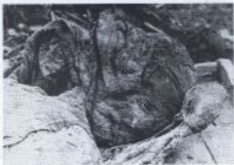
Bild 19: Die auf dem Boden getrockneten Leinwand... (Caption text is partially obscured and difficult to read)