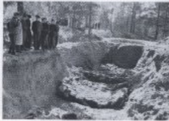
Bild 21. Grabung eines römischen Hauses in der Nähe von Trier.