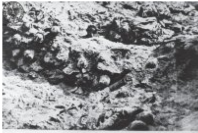
Skull (określenie nieprecyzyjne) z okoliczności (określenie nieprecyzyjne) w okolicy (określenie nieprecyzyjne)