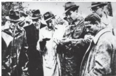
Z poboru Czerwonej Armii powrócił podzi latami wojny do Włochów. Oni służyli w armii na terenach przygotowania do zwycięstwa wojsk.