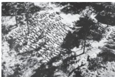
To spocynisko, na którym zostały pochowane ofiary katyńskiej zbrodni, zostało odkryte przez żołnierzy GUR i sowieckich żołnierzy.