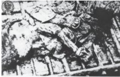
Przemiany ciała; to niegdyś żyłszy, a głębi zimnej wody nie ma...