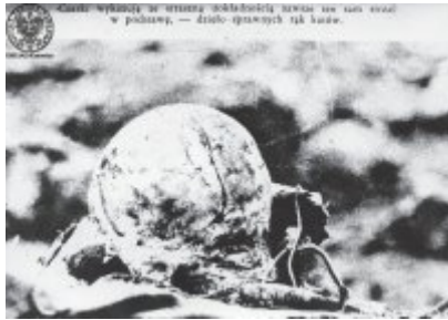
W tym miejscu w czasie okupacji hitlerowskiej nie było cmentarza, tylko w podziwii, — dzieło przetrwałych tu ludzi.