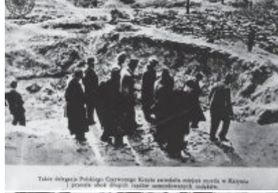
Także delegacja Polaków-Czerwonych Krzyżu odwiedziła miejsce zbrodni w Krasnie i przeszła obok tysięcy innych zamordowanych osób.