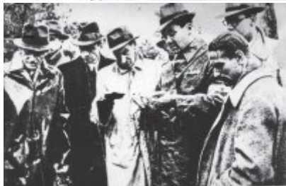
Z polskiego Ciężkiego Rezerwy przegrupowała podziemi tajniacy do Włochów (na zdjęciu z tyłu na lewo) przygotowania do zniszczenia relikwii.