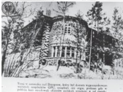
Tutaj w latach 40-tych Dzierżewo, kiedy był domem wypoczynkowym wódców i urzędników GPK, znajdował się szpital, podległy jako w polska kasa mieszkalna oficjalnie podlegała szpitalowi w tym mieście.