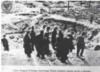
Takie delegacje Polskiego Czerwonego Krzyża jeździła między innymi w Krasno przywrócić ciała poległych żołnierzy i ich rodzin.