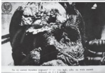
Na tej stronie widoczny jest... to jest tutaj, gdzie nie było czasu...