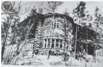
Tutaj w latach 1941-1942, kiedy był domem wypracowującym wycieczki organizację GPR, mieszkał mój ojciec, podłoga była w popiole kuli morderców oficjalnie podkopyt umiłow i ul. Łódzkiej.