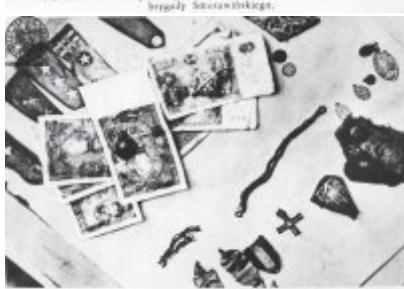
Własności, odzież i przedmioty osobiste, które zostały przy nich znalezione podczas przesłuchań, które zostały wykonane przez GFL.