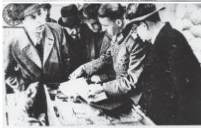
Przedstawicielstwo... w kierunku...