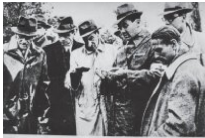
Z pomnika Cmentarza Króla przyniesiono kilka łopatek żelaznych do Wokanda, one służyły do wykopania grobów i przyniesienia ich do miejsca odkrycia.