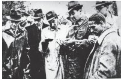
Z polskiego Ciżkowca Karcia przeprowadzono podziemi tunelami do Władysława (na zdjęciu z prawej na pierwszym planie) przygotowania do identyfikowania relikwii.