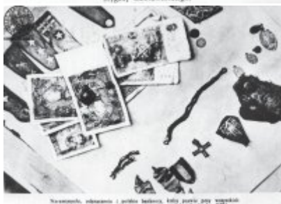
Narzędzia, odzież i inne przedmioty, które zostały przywrócone rodzinom ofiar, które zostały znalezione w miejscu zbrodni.