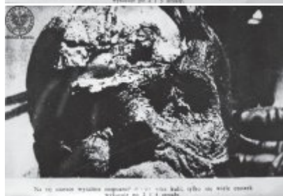
Na tej stronie widoczny fragment ... z ... ciała, które nie było nawet ... 20.02.1946, w gdańsku.