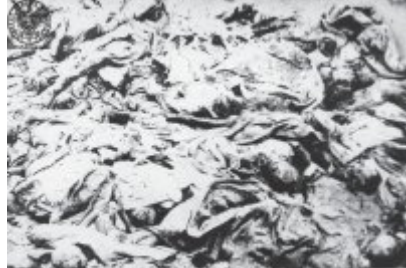
W szesnasty dzień "koniec zabicia przez czołgi hitlerowskie - umierali pod nimi".