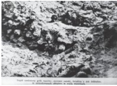
Wielki człowiek, który może być dowodem na to, że jest to człowiek, w tym miejscu.