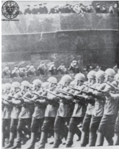
Parada na Placu Czerwonym w 1940r. z okazji zakończenia IV rocznicy Polski.