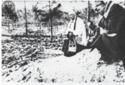
W szkolek sadzono liściar sosnowy i cichodziej Polkięgo Czarnego. Krzysz przed oblataniem polski w lipcu 1945 roku.