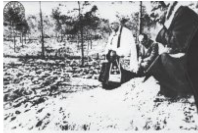
W zbiorach studrowni kłosa wydziałek i ciałokowia Politechniki Czernowiec Kraja przed obłożeniem polow. w dniu lipca 1934 r.