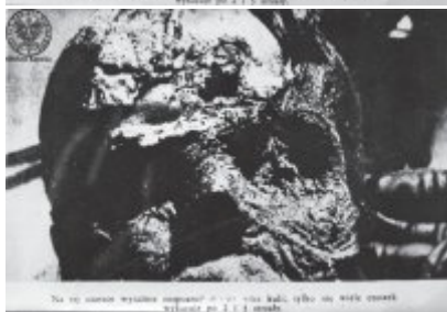
Na wycieczce w obozowej „kuchni” koczni układowi brzozi cmentarz głębia holocaustu. 20.02.1945, w gęstym.