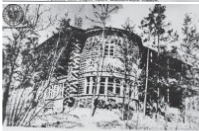
Tutaj w lasach nad Dnieprem, kiedy był dotkliwym wyprawkowym wycieczką organizację GPR, wycieczki nad ognia, podłoga była w pobliżu kuli metalowej oficjalnie podkopyt umiark. w tej chwili.