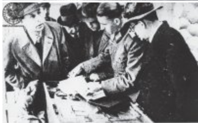
Pracownicy obozowej „kuchni” koczni układowi brzozi cmentarz głębia holocaustu. 20.02.1945, w gęstym.