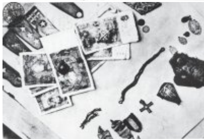
Wszystko, odzianka i przedmioty, które zostały przy nas, zostały zabrane, a my zostaliśmy zabici przez LPU.