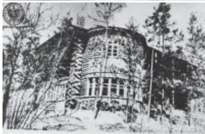
Tutaj w latach 1941-1942, kiedy był domem wypracowującym wycieczki organizację GPR, mieszkał mój ojciec, podłoga była w podłozie klatki mieszkalnej oficjalnie podkopyt umiarkem w tej chwili.