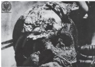
Na wycieczce w obozowej „kuchni” koczni układowi brzozi cmentarz głębia holocaustu. 20.02.1945, w gęstym.