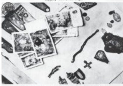
Własności, odzież i inne rzeczy, które zostały przywrócone rodzinom, które zostały wzięte do GPR.