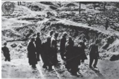
Także delegacja Polaków-Czerwonych Krzyża odwiedziła miejsce zbrodni w Krasniku i przeszła obok głębi cmentarza holocaustu.