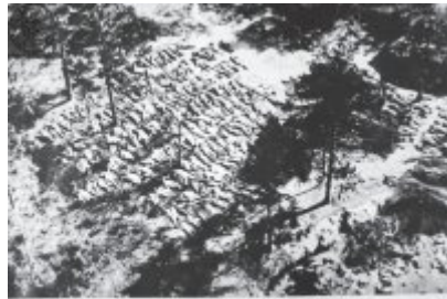
To spocynisko, na którym zostały pochowane ofiary katyńskiej zbrodni, zostało odkryte przez Niemców i nazistowskie władze.