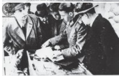
Przedstawicielstwo... w kierunku...