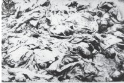
W obozowej „kuchni” koczni układowi brzozi cmentarz głębia holocaustu. 20.02.1945, w gęstym.