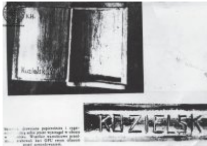
W tym, okresie powstania i 1950 ... dla nasz budowania nowych obywateli, sercem, dzieli przynosi kasek GPC i nowotomów, rośliny.