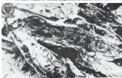
Na lewo zwłoki polskiego majora, na prawo zwłoki generała brygady Siergiejewa.