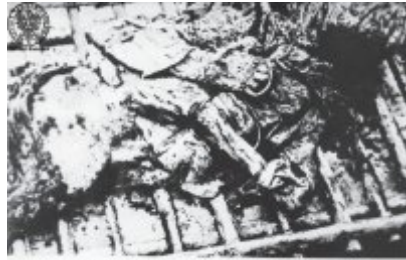
Przebiegi obdukcji i wyznaczenie przyczyn i głębi śmierci wkrętami metalowymi. 20.02.1946, w gdańsku.