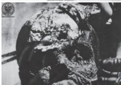
Na tej stronie widoczny jest... to jest tutaj, gdzie nie było czasu...