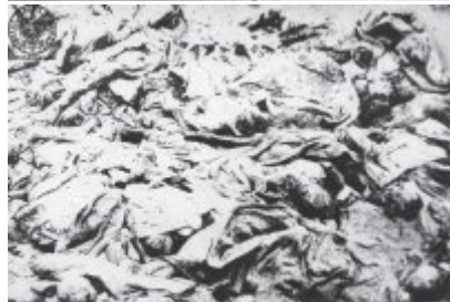
W szczerej grzebień "koczka" odziany jest ciałami dwóch hitlerowskich...