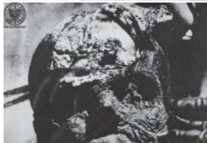
Na tej stronie widoczny fragment ... z ... ciała, które nie było nawet ... 20.02.1946, w gdańsku.