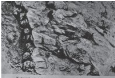
W skrajnych połaciach, między innymi widoczny jest fragment grobowca podziemnego.