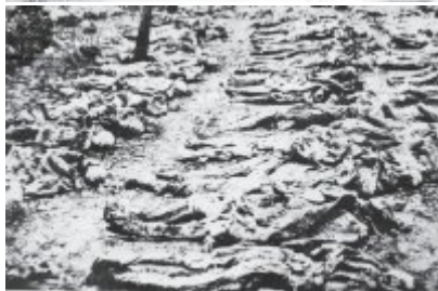
To miejsce polski są obywateli dokonano holocaustu.