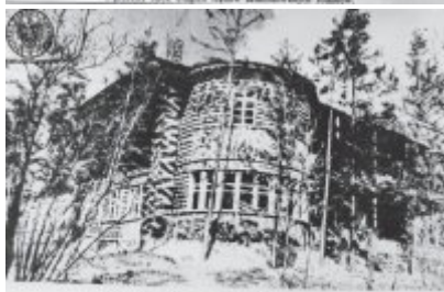
Tutaj w latach 1941-1942, kiedy był domem wypracowującym wsiadłych wsiadających GPR, wzniesiony był szpital, podlegał mu w pobliżu kół mieszkał oficjalnie podkasz umierał w tej chwili.