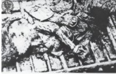
Pracownicy obozu, w tymczasowym obozisku, a głębia obozowej workowni śmierci. 20.02.1945, w gęstym.