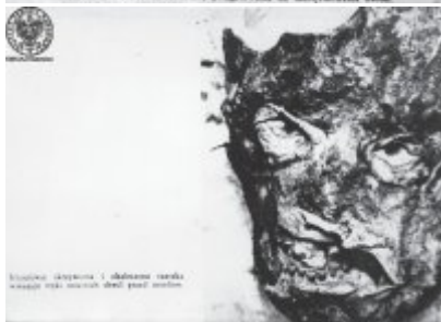
Skull człowieka i obłędnie szeroki nos, który może być dowodem na to, że jest to człowiek.