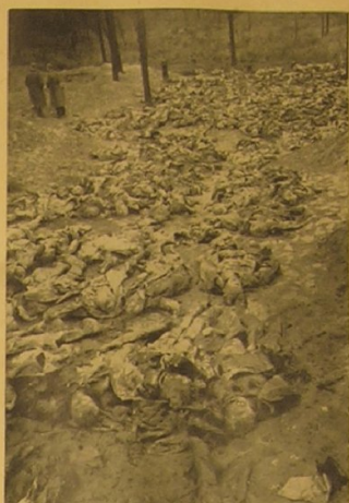
Unübersehbar ist das Leichenfeld.