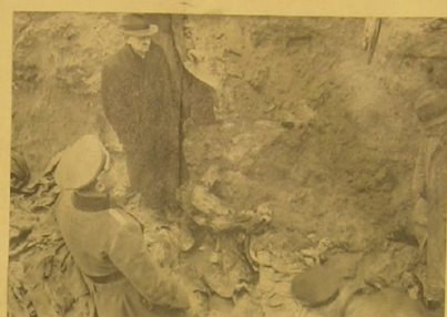
Mitglieder der polnischen Abordnung in einer der tiefen Gruben, aus denen die Leichen zum Teil bereits geborgen sind.