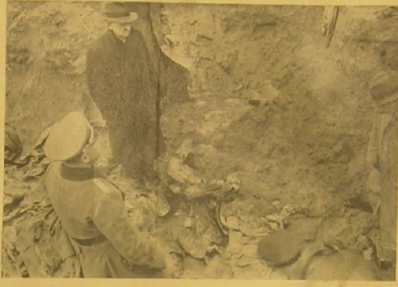
Mitglieder der polnischen Abordnung in einer der tiefen Gruben, aus denen die Leichen zum Teil bereits geborgen sind. Członkowie delegacji polskiej w jednym z głębokich dołów, z których zwłoki częściowo już wydobyto.