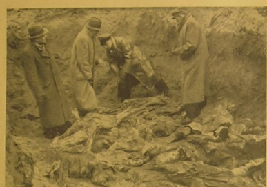
Die polnische Abordnung aus dem Warthegau identifiziert selbst eine der Leichen. Mitglieder der polnischen Delegation aus Warthegau identifizieren persönlich einen Leichnam.