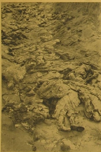
Blick in eine der Gruben.

Prace nad wydobywaniem zwłok w Katyniu. — Na planie pierwszym mundur jednego ze zidentyfikowanych oficerów polskich.