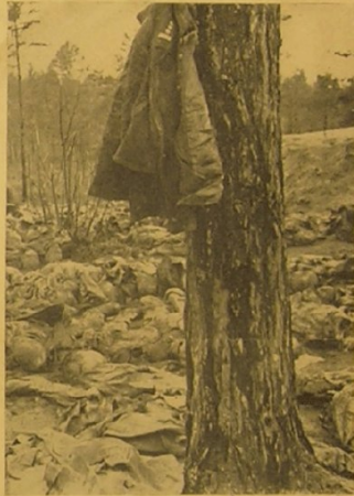
Die Bergungsarbeiten in Katyn. — Im Vordergrund die Uniform eines bereits identifizierten polnischen Offiziers.

Prace nad wydobywaniem zwłok w Katyniu. — Na planie pierwszym mundur jednego ze zidentyfikowanych oficerów polskich.