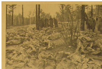
Blick auf die Stätte des Grauens. — In der Mitte polnische Hilfspolizisten, die an den Bergungsarbeiten beteiligt sind.