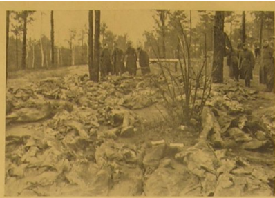
Blick auf die Stätte des Grauens. — In der Mitte polnische Hilfspolizisten, die an den Bergungsarbeiten beteiligt sind.