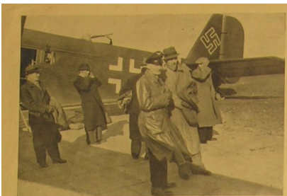
Die polnische Abordnung aus Posen und Litzmannstadt auf dem Flug nach Smolensk. Delegacja polska przed odlotem do Smolenska.