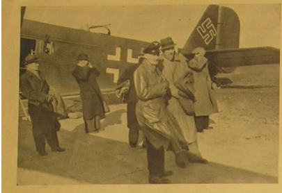
Die polnische Abordnung aus Posen und Litzmannstadt auf dem Flug nach Smolensk. Delegacja polska przed odlotem do Smolenska.