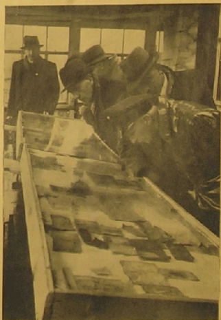
Die polnische Delegation aus Posen und Litzmannstadt besichtigt die Dokumente und Gegenstände, die in den Uniformen der polnischen Offiziere gefunden wurden.