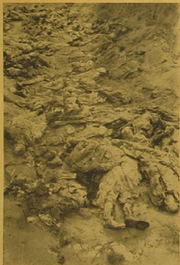
Blick in eine der Gruben.