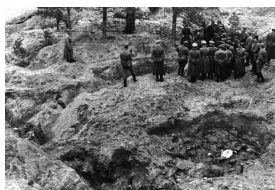
Ekshumacje w Lesie Katyńskim, 1943 r.