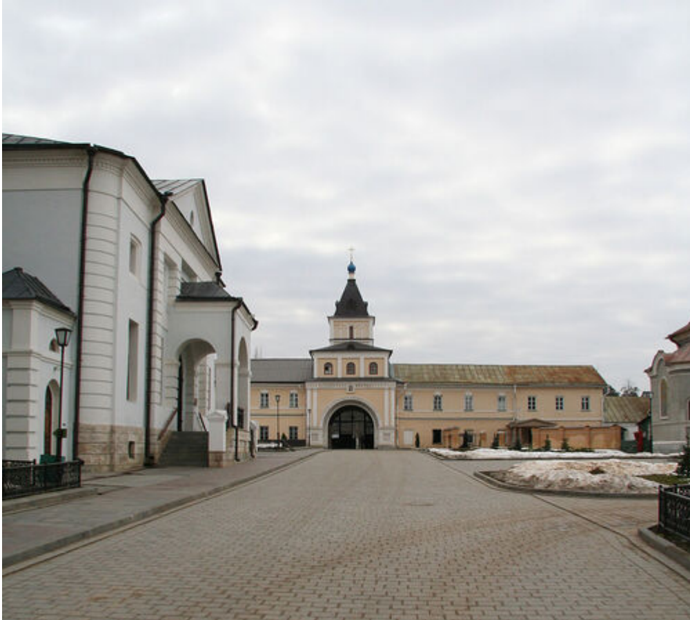
Kozielsk, brama wjazdowa

Obóz kozielski zorganizowano na terenie byłego monasteru Pustelni Optyńskiej. Tworzyli go mnisi eremici, zwani starcami, cieszący się niezwykłym autorytetem duchowym. Przybywało tam wielu ludzi szukających spokoju wewnętrznego lub pociechy, także sławnych, takich jak Lew Tołstoj, Władimir Sołowjow czy Fiodor Dostojewski po śmierci syna. Zespół składał się z dwóch części – monastynu i oddalonego o kilkaset metrów tzw. skitu (eremu). Klasztor miał kilkanaście murowanych budynków w tym kilka cerkwi otoczonych murem i fosą. Tuż za lasem znajdował się skit gdzie kiedyś mieszkali mnisi. Były to głównie drewniane skromne domy i hotele dla pielgrzymów. W 1923 r. bolszewicy przejęli cały obiekt, zamieniając główną cerkiew (jedną z sześciu) w tartak, a skit – w dom wypoczynkowy NKWD. Zaraz po rewolucji krzyże pozdejmowano, a wieże kościołów zburzono, leżały jeszcze nieuprzątnięte, kiedy w listopadzie 1939 r. przybyli pierwsi polscy jeńcy. W 1987 r. Władze zwróciły Pustelnię Optyńską Rosyjskiemu Kościołowi Prawosławnemu.