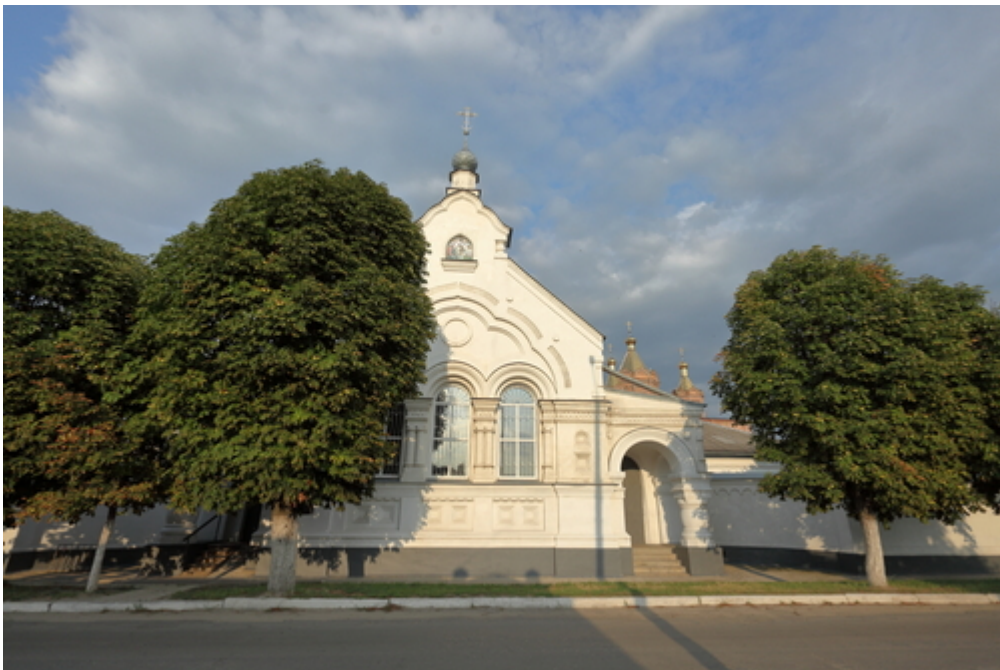
Cerkiew Trójcy Świętej, Starobielsk