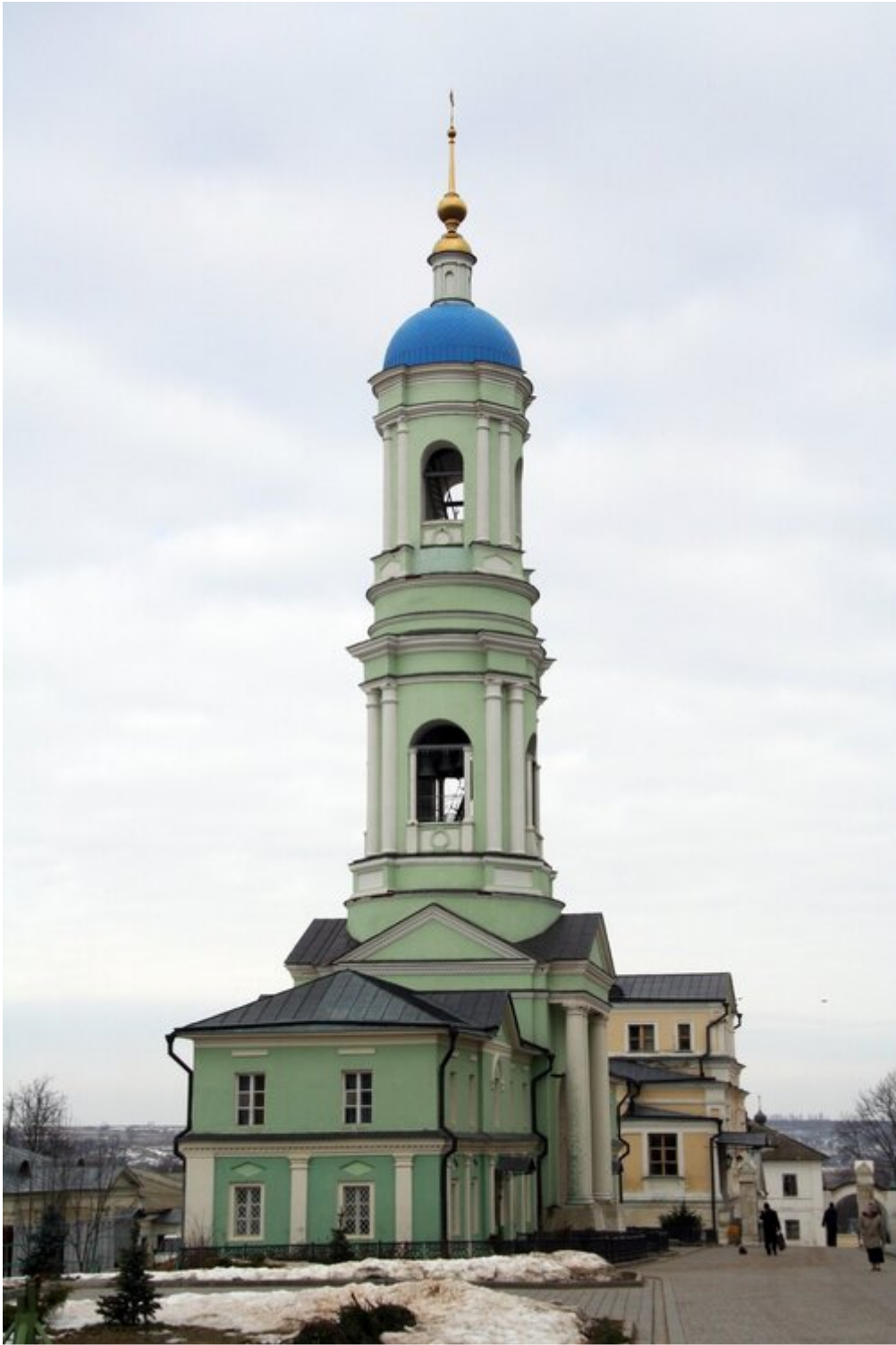
Kozielsk, dzwonnica optyńskiego klasztoru , fot. domena publiczna