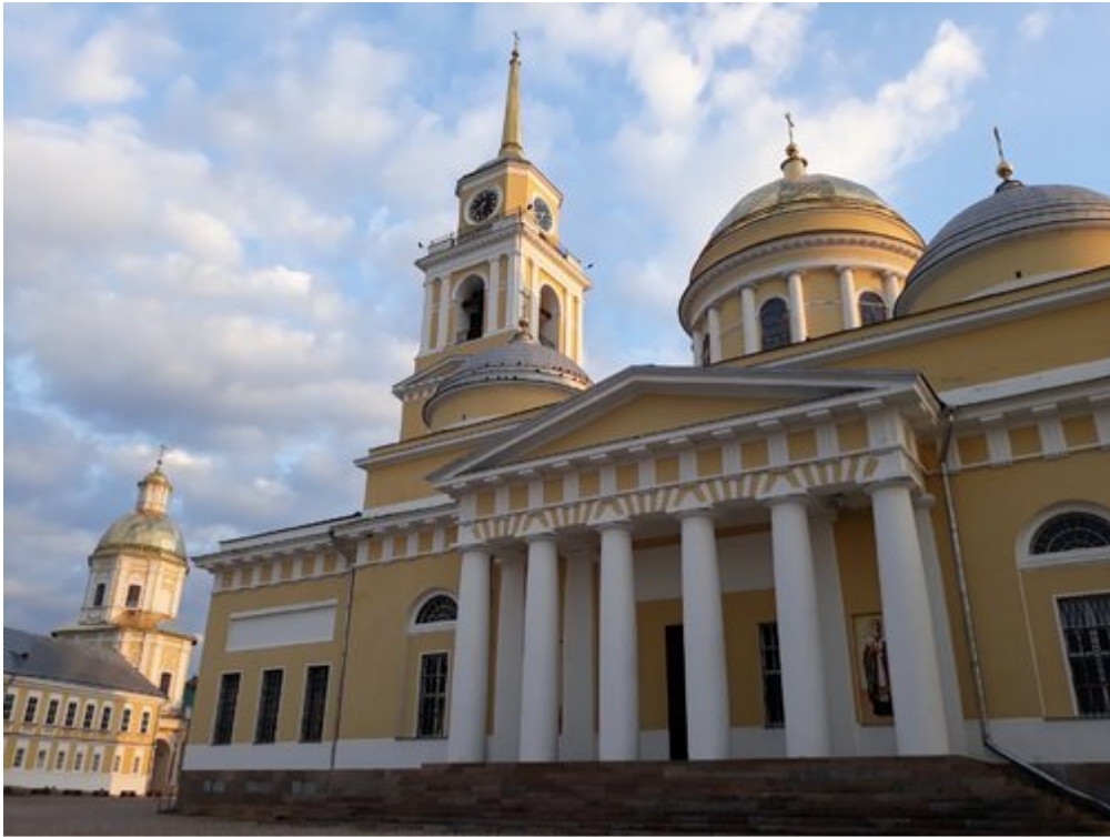
Monastyr i Pustelnia Niłowo-Stołobieńska, Ostaszków