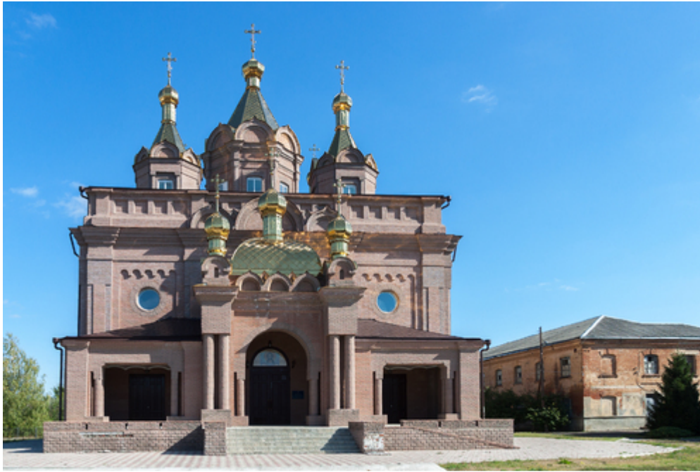
Cerkiew Trójcy Świętej, Starobielsk