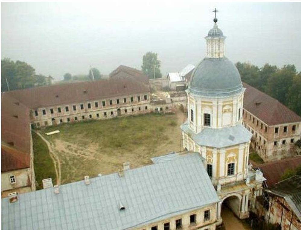
Ostaszków lata 90 XX wieku

W myśl rozkazu Berii z 19 września 1939 r. miało powstać osiem obozów właściwych, a 22 września uzgodniono utworzenie dwóch dodatkowych.