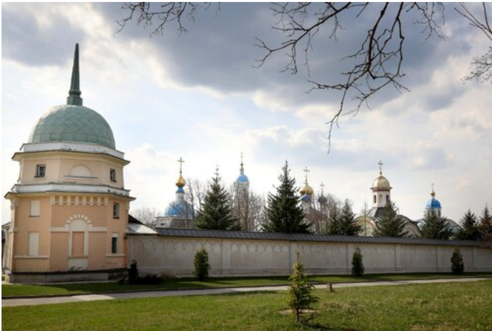
Pustelnia Optyńska, Kozielsk