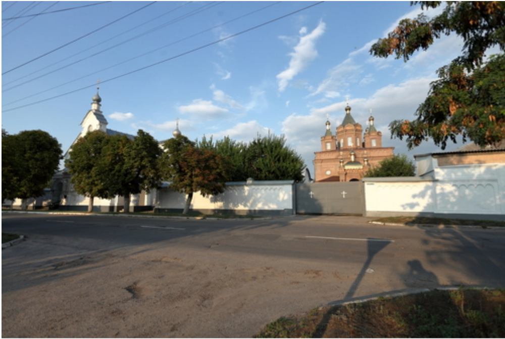
Cerkiew Trójcy Świętej, Starobielsk