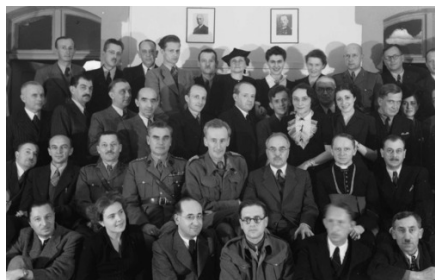
Polskiej Biuro Inforamcji, 1943 r.

W Rzymie po raz pierwszy ukazały się drukiem jego relacje z pobytu w Związku Radzieckim pod tytułem Wspomnienia starobielskie oraz nieco później Na nieludzkiej ziemi .