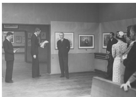
Józef Czapski (w środku) wygłasza przemówienie poświęcone pamięci Zygmunta Waliszewskiego, z prawej widoczny wiceminister wyznań religijnych i oświecenia

W 1926 r. zachorował na tyfus i wyjechał do Londynu na rekonwalescencję.