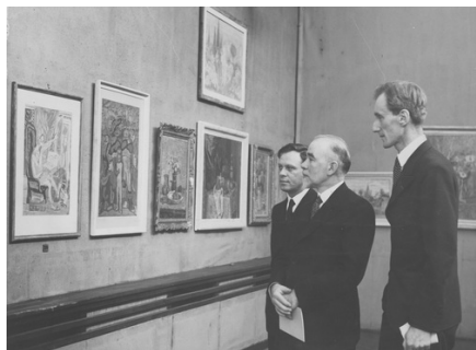
Wystawa pamiątkowa Zygmunta Waliszewskiego oraz zbiorowa Aleksandra Rafałowskiego i Lucjana Adwentowicza w Instytucji Propagandy Sztuki w Warszawie, 1937, fot. Narodowe Archiwum Cyfrowe

publicznego Józef Ujejski, 1937 r, fot. Narodowe Archiwum Cyfrowe