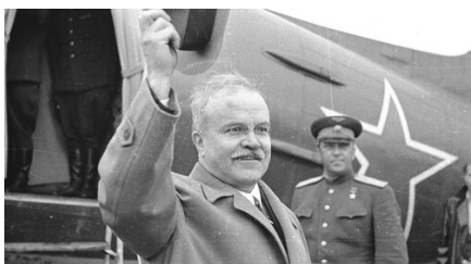
Wiaczesław Mołotow