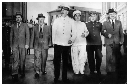
Anastas Mikojan, Nikita Chruszczow, Józef Stalin, Georgi Malenkow, Ławrientij Beria, Wiczesław Mołotow