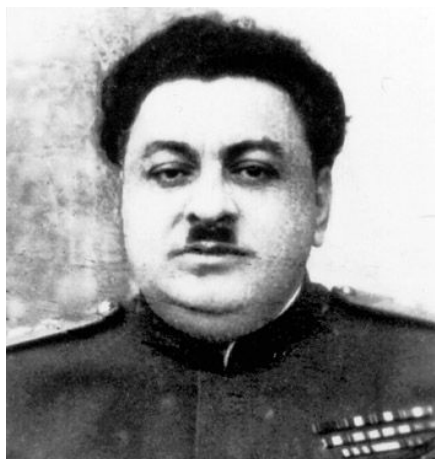
Bogdan Kobulow