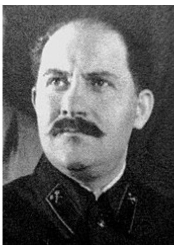
Lazar Kaganowicz