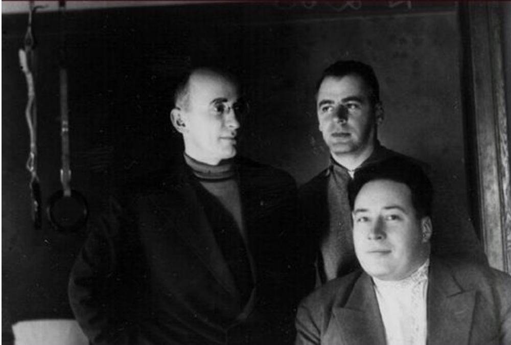
Ławrientij Beria i Wesiwołod Mierkułow (stoi po prawej) na zdjęciu z 1934 r.