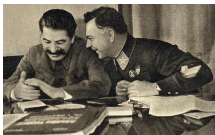
Józef Stalin i Klimient Woroszyłow