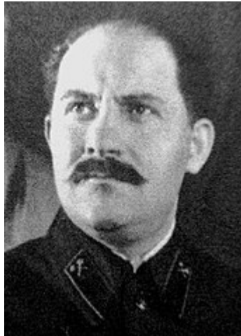
Lazar Kaganowicz