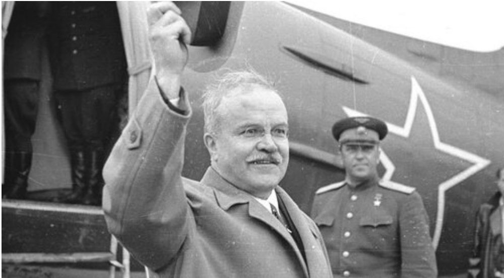
Wiczesław Mołotow