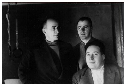
Ławrientij Beria i Wesiwołod Mierkułow (stoi po prawej) na zdjęciu z 1934 r.