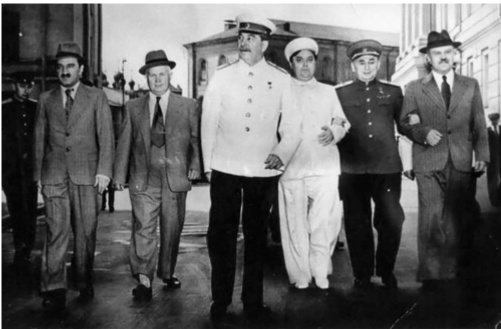
Anastas Mikojan, Nikita Chruszczow, Józef Stalin, Georgi Malenkow, Ławrientij Beria, Wiczesław Mołotow