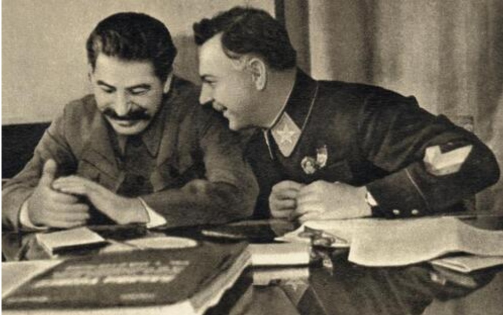
Józef Stalin i Klimient Woroszyłow

Rozkaz o rozstrzelaniu polskich jeńców zaakceptowali również Łazar Moisiejewicz Kaganowicz (jeden z głównych realizatorów „czystek” zarówno w partii jak i poza nią) oraz Michaił Iwanowicz Kalinin (przewodniczący Prezydium Rady Najwyższej ZSRS). Do listy głównych sprawców należy też dodać nazwiska Wsiewołoda Nikołajewicza Mierkułowa – faktycznego kierownika operacji „rozładowania” obozów jenieckich i więzień w kwietniu i maju 1940 r.; Bogdana Zacharewicza Kobułowa – członek Specjalnego Kolegium NKWD (tzw. centralnej trójki), które bezpośrednio organizowało i nadzorowało akcję rozstrzeliwania polskich jeńców wojennych i więźniów oraz Leonida Fokiejewicza Basztakowa, który w marcu 1940 r. został szefem Wydziału 1 Specjalnego NKWD ZSRS i wszedł w skład Specjalnego Kolegium NKWD, któremu powierzono zadanie wymordowania polskich jeńców wojennych.