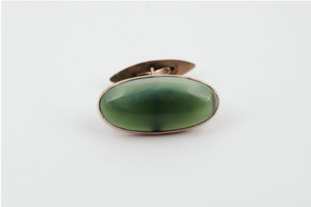
Spinka do mankietu, fot. Muzeum Katyńskie