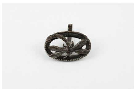
Spinka do mankietu, fot. Muzeum Katyńskie