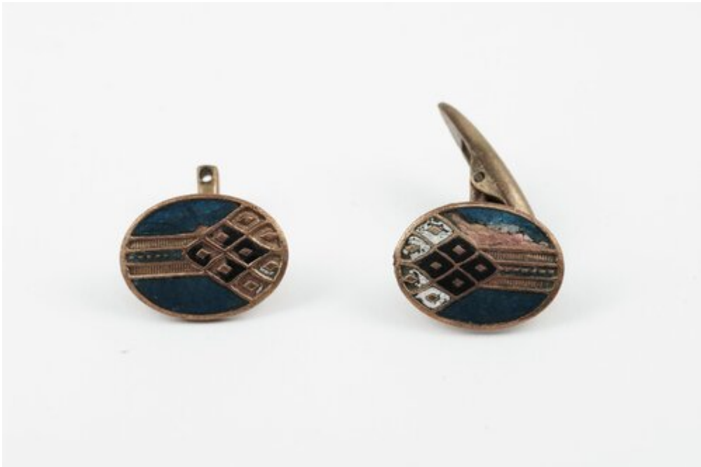
Spinki do mankietów, fot. Muzeum Katyńskie