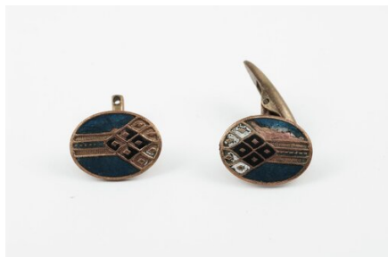
Spinki do mankietów