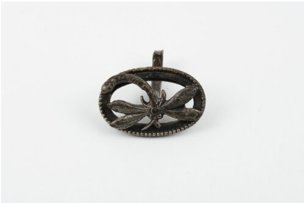
Spinka do mankietu, fot. Muzeum Katyńskie