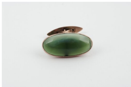
Spinka do mankietu